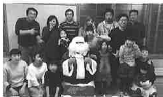
家族親睦クリスマスパーティ&忘年会