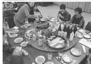
阿寒町商工会女性部設立50周年記念式典