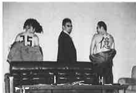
チャリティーかくし芸大会 熱演中!