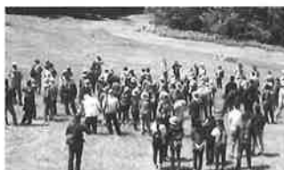
阿寒の森ハイキング