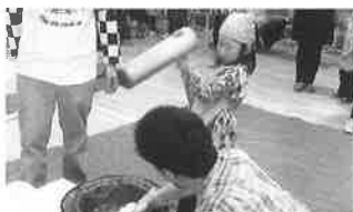
幼稚園合同もちつき大会