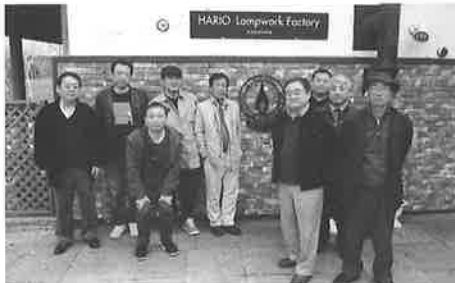
大雪 森のガーデン