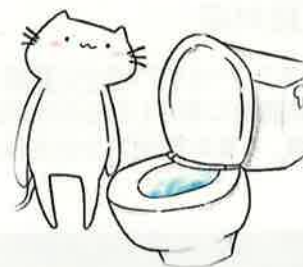
阿寒湖温泉地区ストレスフリーエリア